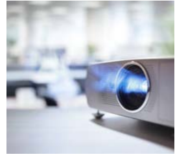
Location de matériel

Exposez nous votre projet, il existe une solution au Bissac.